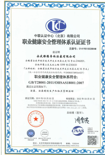
质量、环境及职业健康安全管理体系认证证书