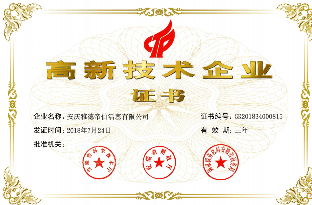
高新技术企业证书